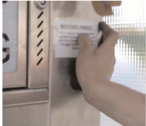
...anschließend den Füllknopf drücken und halten. Wer vor dem automatischen Stopp den Taster loslässt, muss von vorn anfangen