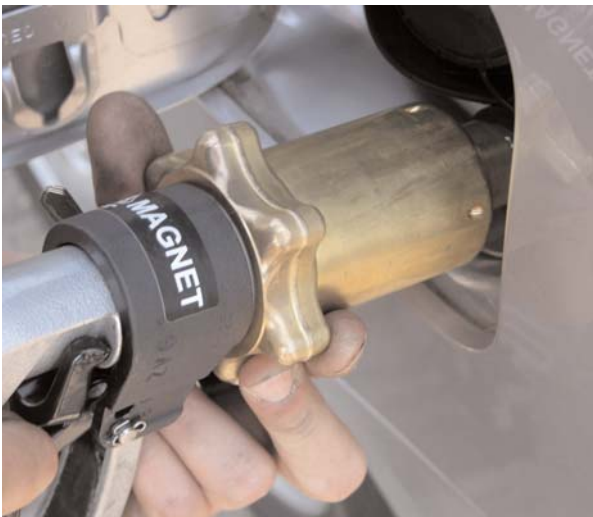
...Zapfpistole per Überwurfzylinder festdrehen, Ventil öffnen und wie bei einer „normalen“ Zapfpistole festsetzen...