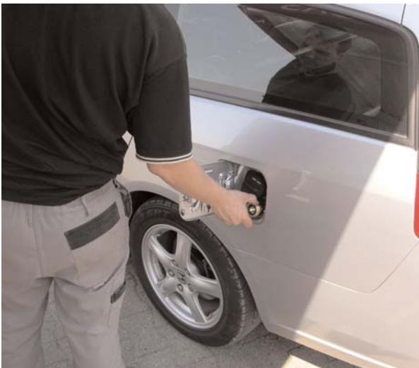
Drehmoment: Tankadapter auf den Stutzen schrauben...