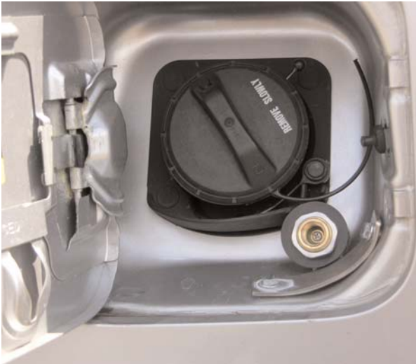
Diskret tanken: Der Einfüllstutzen liegt gut erreichbar hinter der Tankklappe